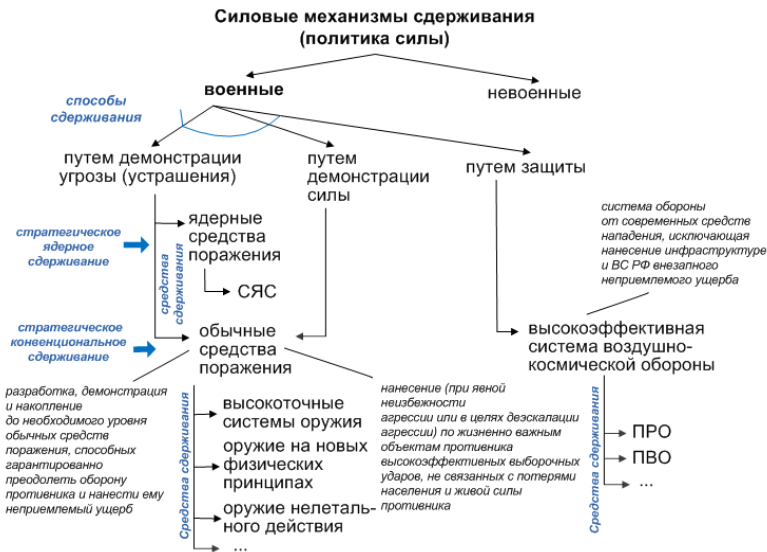
Рис. 2 – Силовые военные механизмы сдерживания

Невоенные меры сдерживания (рис. 3) приобретают все большую значимость.