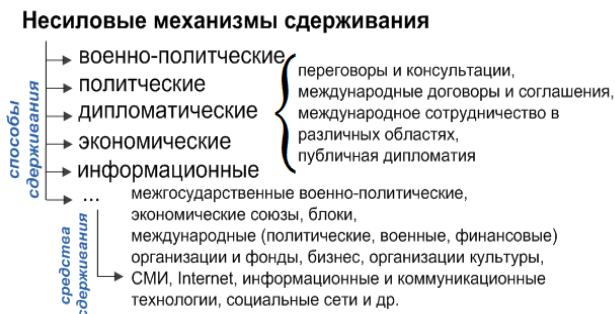
Рис. 4 – Несиловые механизмы сдерживания

Наконец, несиловые механизмы сдерживания ориентированы на соблюдение принципов и норм международного права и взаимовыгодное сотрудничество (рис. 4).